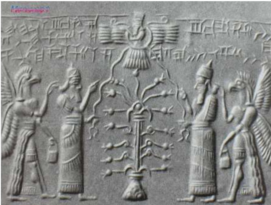
ÁRVORE DA VIDA ASSÍRIA

No entanto, quando a sujeitamos a algum controle e ao bom senso, essa liberdade sem limite se converte em impulso e iniciativa para tentarmos o NOVO . E aquele que faz o Caminho dos Reis munido do critério, do bom-senso, da lógica, usará a liberdade com responsabilidade .