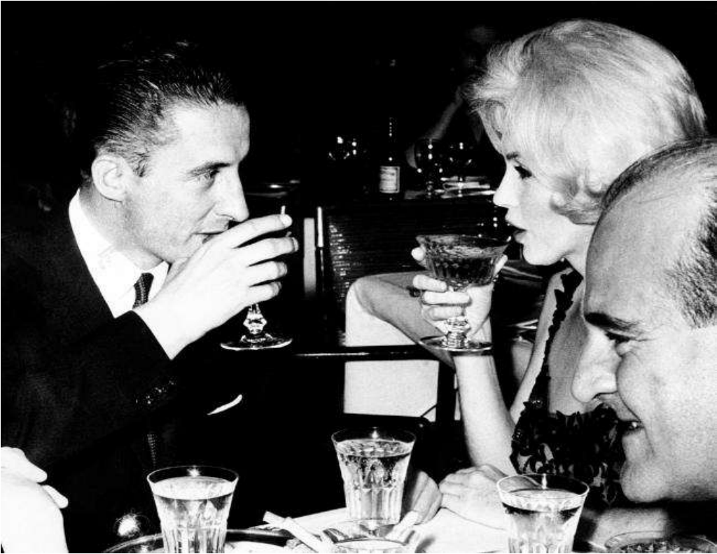
Los Angeles authorities concluded Monroe's death was a probable suicide.