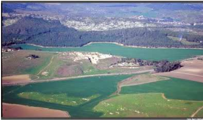
Megido (Ou vale de Jezreel)

Os azuis, ou seja, a geração que receberá o antigo poder de comunicar-se com os Anjos (bons), será uma floração. Eles serão contra tudo que negar Jesus de Nazaré.