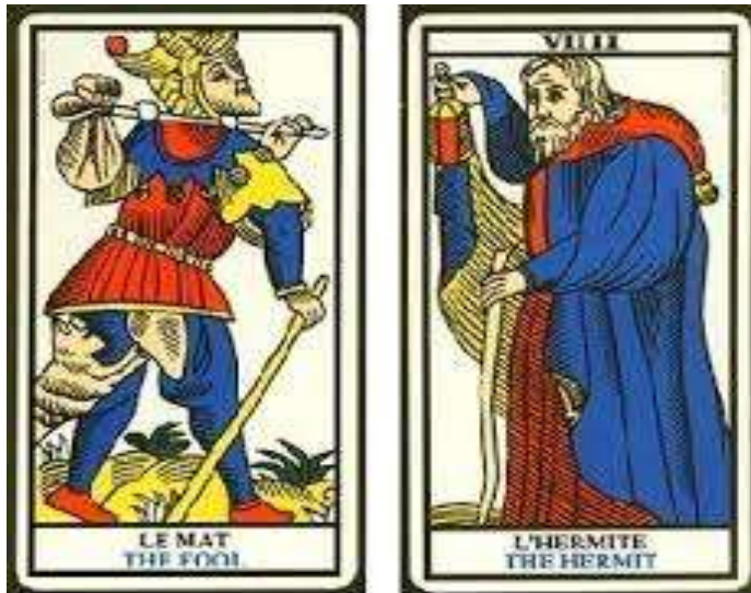
Marseille de Grimaud

-“Ora, Raphael – explicou o EREMITA – ninguém nasce sabendo. O conhecimento que ele traz não apresenta nenhuma evidência de aplicação. Podemos dizer, então, que ELE SABE, MAS NÃO SABE QUE SABE ”.